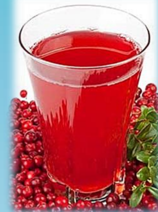
Морс из ягод